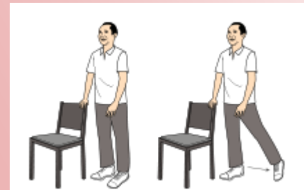
2. Til het been naar buiten